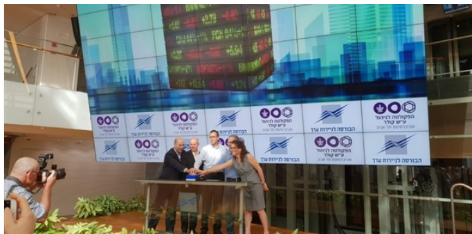
השקת המדד ת"א-פמילי בבורסה לניירות ערך

אוקטובר 2018 הושק בבורסה לניירות ערך בתל אביב מדד המשפחתיות הציבוריות. המתודולוגיה לסיווג חברות ניות פותחה במרכז רעיה שטראוס לחקר עסקים יים בפקולטה לניהול ע"ש קולר באוניברסיטת תל אביב, הבורסה לניירות ערך, והותאמה למאפייני השוק המקומי.